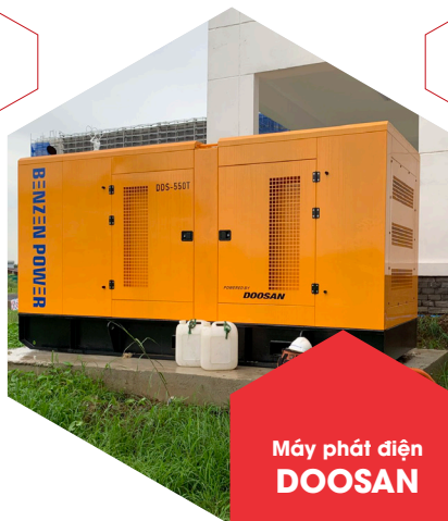
Máy phát điện DOOSAN

Perkins là dòng máy nhập khẩu từ Anh Quốc, có công suất lớn, hoạt động tốt trong môi trường khắc nghiệt, vận hành ổn định, tiết kiệm nhiên liệu mà lượng khí thải luôn được đảm bảo ở mức ổn định, an toàn cho người sử dụng