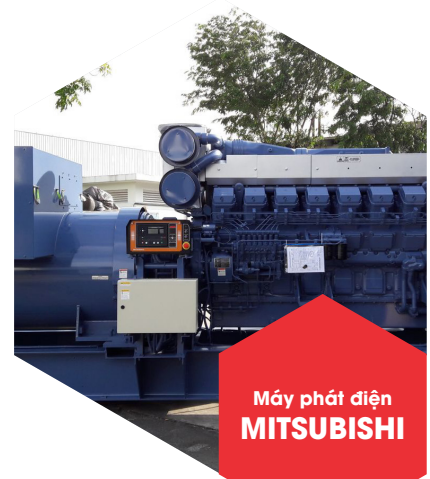
Máy phát điện MITSUBISHI

Các chuyên gia của Benzen Power cung cấp sự kết hợp tối ưu giữa thiết kế giải pháp, thiết bị tích hợp và phần mềm cũng như các dịch vụ vận hành và bảo trì liên tục để giúp bạn duy trì cung cấp nguồn điện liên tục cho mọi hoạt động kinh doanh, sản xuất hay sinh hoạt