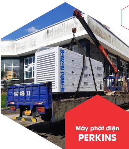
Máy phát điện PERKINS

Mitsubishi là thương hiệu nổi tiếng của Nhật Bản. Động cơ Mitsubishi có công suất cao, siêu bền, vận hành êm và tiết kiệm nhiên liệu. Chính vì thế Mitsubishi luôn đáp ứng và đem lại hiệu quả kinh tế cao cho người sử dụng