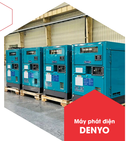
Máy phát điện DENYO

Sản phẩm được sản xuất bởi tập đoàn Doosan danh tiếng của Hàn Quốc. Động cơ có độ bền cao, đảm bảo máy phát điện chạy bền bỉ, dự phòng trong thời gian dài. Luôn được đánh giá cao trên thị trường về sự uy tín và chất lượng.