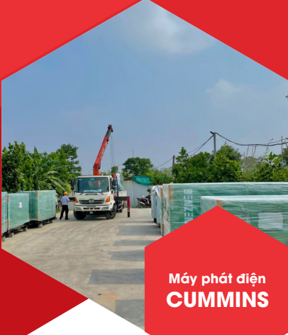
Máy phát điện CUMMINS