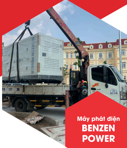
Máy phát điện BENZEN POWER

Máy phát điện Cummins được nghiên cứu và thiết kế hướng tới sự vượt trội về đáp ứng giải pháp nguồn điện dự phòng cho mọi công trình. Mang đến sự trải nghiệm sản phẩm đơn giản, thân thiện và trải nghiệm hài lòng nhất với người dùng